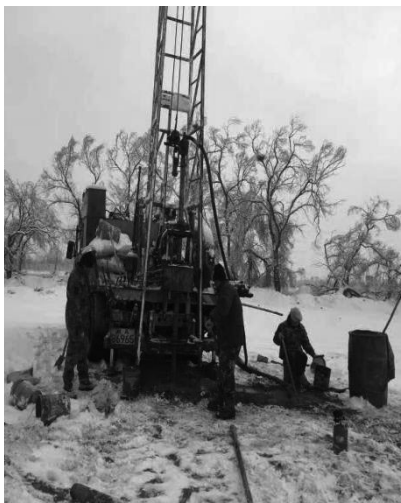
图2 牙轮钻头全面钻进现场

压缩空气,通过孔壁与钻杆间隙,将钻屑排至孔口。在钻探过程中,不同地层不同状态下钻头处的动力反馈不同,孔口出渣也不同,可以较准确判断孔底地层。