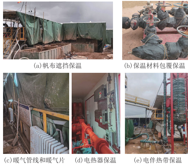
图 2 现场保温处理措施

数 0.04\text{ W}/(\text{m}\cdot\text{K}) )、玻璃棉(导热系数 0.034\text{ W}/(\text{m}\cdot\text{K}) )、聚氨酯保温材料(导热系数 0.024\text{ W}/(\text{m}\cdot\text{K}) )和发泡塑料制品(导热系数 0.02\text{ W}/(\text{m}\cdot\text{K}) ) [26-29] 。综合考虑高海拔地区施工难度、运输和环保等问题,选用玻璃棉作为本项目的保温材料。