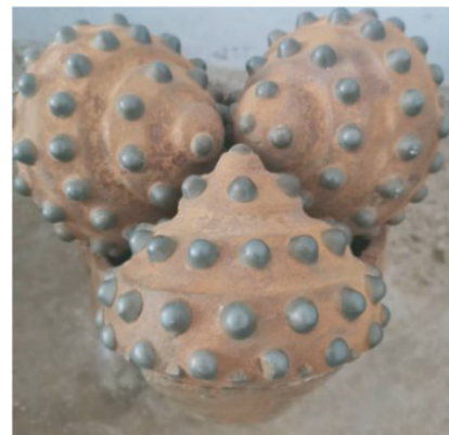
图4 Ø215.9 mm 井段LST637GDH型 钻头磨损状况照片

LST637GDH型钻头在D05井三开3120~3196 m段回次钻进76 m,整只钻头仅有数颗外排齿崩裂,钻头磨损较轻(见图4),钻头磨损严重、使用寿命低的问题得到解决。