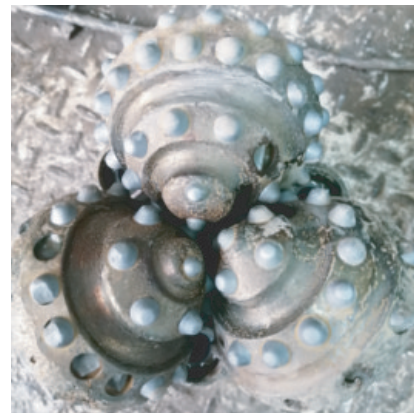
图8 \text{O}152.4 mm 井段磨损较严重的MD637HDY型钻头照片