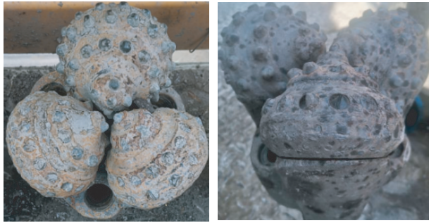
图3 Ø215.9 mm 井段磨损严重的LS617GL型钻头照片 Fig.3 Photo of LS617GL bit with severe wear in Ø215.9 mm well section

坏,特别是处于钻头牙轮外圈的硬质合金齿,其在回转的过程中线速度更高,承受的冲击力也就更大 [9-10] ;另一方面,软硬不均的岩石会使得牙轮钻头在回转过程中产生较大的纵向振动力,这本是牙轮钻头冲击碎岩的能量来源,有利于提高牙轮钻头碎岩效率 [11] ,但较大的纵向振动会使牙轮钻头硬质合金齿承受的冲击力增加,加快牙轮钻头硬质合金齿的损坏;同时螺杆钻具提供的较高转速,进一步增强了以上两种现象,加快了钻头牙轮硬质合金齿的损坏。钻头牙轮的硬质合金齿在达到受力极限时发生崩断,进而使钻头牙轮体直接与地层岩石接触而造成磨损;崩断的硬质合金齿在孔底形成“钢粒”效应,加剧牙轮的磨损 [12-13] ,从而造成钻头磨损严重、甚至是钻头事故。