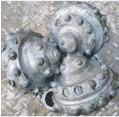
图6 \text{O}152.4 mm 井段磨损严重的MD617HDY型钻头照片