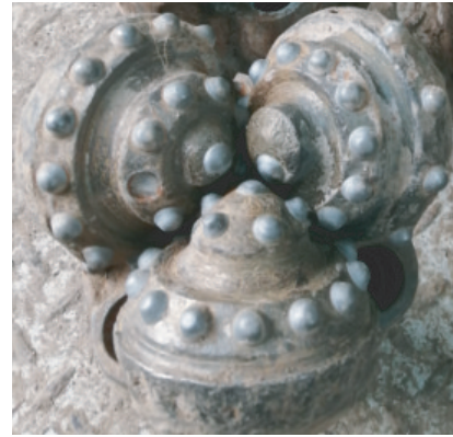
图7 \text{O}152.4 mm 井段磨损严重的LST637GDH型钻头照片