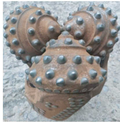
图5 \varnothing 215.9 mm井段MD617HDY型钻头磨损状况照片

D05井自井深3304 m开始使用MD617HDY型钻头,机械钻速达到了1.76 m/h,首只钻头钻进110 m后起钻检查,钻头磨损较轻,见图5。D05井继续使用该型号钻头钻进至3886 m完成三开 \varnothing 215.9 mm井径钻探任务,期间未再出现钻头磨损严重的现象。该型号钻头的使用寿命约110~140 m,基本满足了钻进需求,同时平均机械钻速达到了1.74~1.82 m/h,机械钻速亦恢复至原正常水平,见表5。