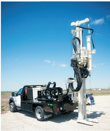
图1 Model7800 型钻机 Fig.1 Model 7800 drill rig

直推技术起源于20世纪20年代的荷兰,当时荷兰人在进行收集岩土和水文地质数据及土壤和地下水样品的时候,直接将锥形取样或测量装置推入地下;到20世纪90年代,随着国外的环境钻探项目日益增多,为快速高效地获得高质量原状土样品,美国 Geoprobe 公司率先在钻机中应用了直推技术,在首次应用中钻进速度明显超过普通回转钻机,目前该公司生产的 Model7800 型直推式静压取样钻机(见图1),具有直推和声频振动钻进功能且车载方式使其具有在野外能快速往返于不同取样地点的特点 [18-19] 。