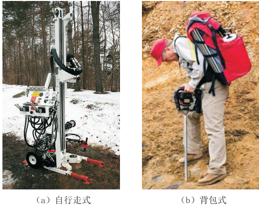
图4 回转钻机 Fig.4 Rotary drill rig

机移动,该类钻机通常由柴油机/汽油机、桅杆、卷扬机和动力头组成;(2)背包式钻机,主要由主机、钻具和钻杆组成。两种回转钻机的工作原理是钻杆和动力头或主机相连,动力头或主机带动钻杆回转并加压,冲洗液通过钻杆内部流入孔底,冷却钻头,并携带岩屑从钻杆外壁和钻孔间隙之间返回到地面 [32-34] 。