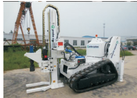
图2 Eprobe2000 型钻机 Fig.2 Eprobe2000 drill rig

我国在进入21世纪之后,原建设在城市内部的工业园区外迁趋势加快,原有场地转变为商业或居民用地,对这些场地的污染状况调查引发了国产环境钻机的研制热潮。此时,国外的直接推进钻探技术进入中国,经过十几年发展,南京贻润环境科技有限公司自主研制出了智能化程度较高的土壤地下水环境取样修复一体机,其中 Eprobe2000 型钻机(见图2)不仅可以远程无线遥控,还因行走装置设计成三角形提高了场地通过性。