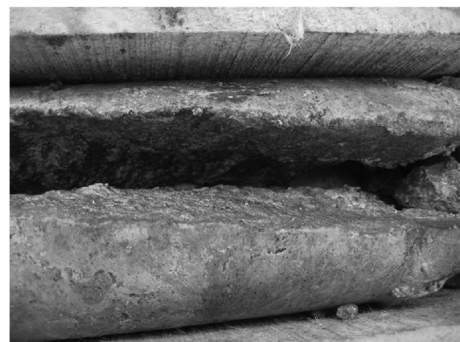
图4 宽大的岩石裂隙

由于乌拉根矿区构造属于海相沉积型,生物介壳灰岩、灰岩、白云岩等较为发育,加之后期地质作用改造剧烈,褶皱和断裂极为发育,浅层低温热液改造,以及地下水的影响,在灰岩层中岩石裂隙发育,裂隙的宽度从1~15 mm不等,取上的岩心自然两半,裂隙面布满黄褐色的水锈,并有数量较多的小溶洞(见图4、图5)。裂隙与溶洞的大量存在导致钻孔泥浆漏失严重。