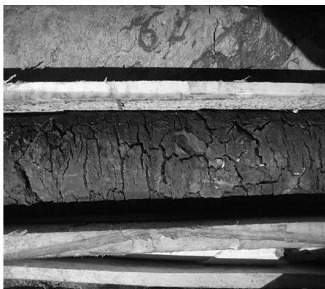
图1 膨胀的泥岩岩心

在乌拉根矿区地层中,含有厚大的泥岩和石膏层位,根据钻孔岩心情况,泥岩层0.3~20 m不等,石膏层0.5~26 m不等。该地区泥岩与石膏的共同特点是遇水膨胀(见图1),引起钻孔缩径,缩径后导致钻杆在孔内阻力增大,严重时卡钻,缩径层以下的钻杆、钻具无法提出,造成钻孔报废、管材报废等巨大的经济损失。由于施工用钻头主要为孕镶金刚石钻头,钻遇泥岩时,泥巴容易将钻头水口糊死,以致钻头得不到循环泥浆的冷却而烧钻,尤其是在高转速钻进时,短短十几秒就能造成严重烧钻。