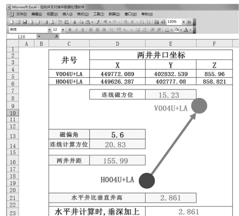
图 1 EXCEL 初期定向数据处理