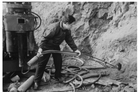
图 2 现场试验图片

场不用采取防腐剂、波纹管等防锈措施,施工工艺更加简便、快捷。同时,外锚具张拉、锁定方便,锚固性