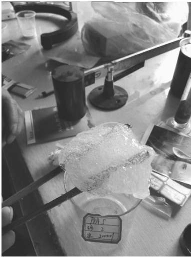
图 6 凝胶成胶