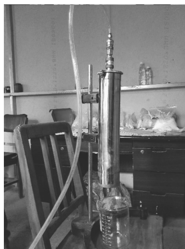
图3 模拟堵漏测试仪