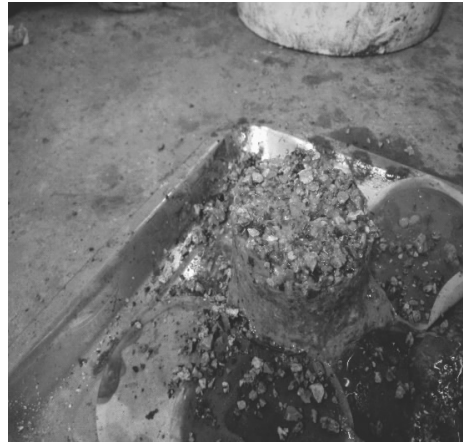
图 8 加入植物胶堵漏效果

将配方(8)(清水+3%PVA+2%硼砂+1%植物胶)配置的凝胶取 4 g, 2 g 加入 40 mL 基浆(钠土+纯碱), 2 g 加入 40 mL 清水中浸泡。