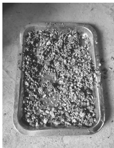
图4 模拟破碎地层所用砂石