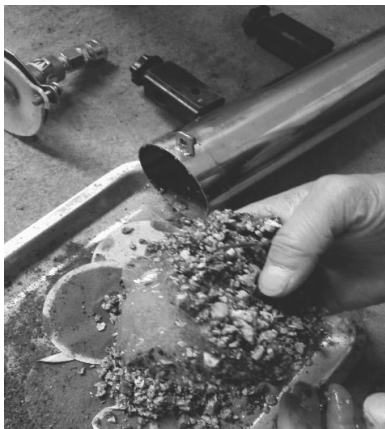
图 7 凝胶堵漏效果图