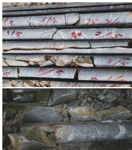
图1 ZK2216孔孔深124.22~127.22 m岩心

受限于矿区原有材料设备,前期施工中发生大量孔内事故,直接影响了钻进效率、钻探质量和经济效益。后经过摸索,采用绳索取心顶漏钻进工艺、全面钻进顶漏钻进工艺成功穿过上部漏失层,最终全部顺利终孔。