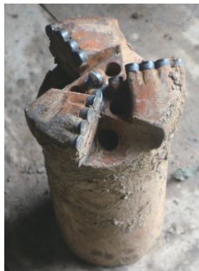
图3 \text{O}152.4\text{mm} PDC全面钻头 Fig.3 \text{O}152.4\text{mm} PDC rock bit