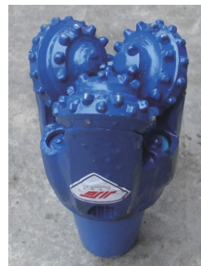
图4 \text{O}152.4\text{ mm} 镶齿三牙轮钻头(S537G) Fig.4 \text{O}152.4\text{mm} toothed three-wheel roller bit(S537G)

PDC全面钻头适用于钻进软—中硬地层,钻进效率较高,但在软硬互层时钻具憋、跳严重。牙轮钻头通过牙轮滚动带动其上切削齿冲击、压碎和剪切破碎岩石,能适应软—中硬的多种地层钻进,钻进相对平稳,钻机加压12~15 kN能维持较正常的钻进效率。