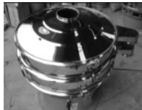
图2 微型高频双层圆形振动筛实物