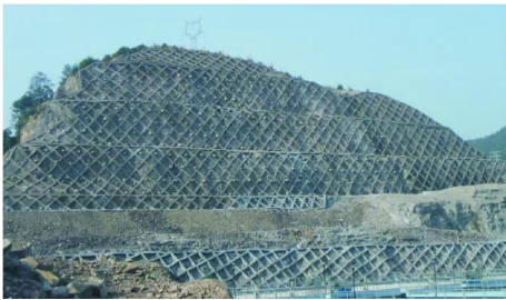
图4 治理后的边坡照片

根据边坡水平位移、垂直位移、地表裂缝的各次监测成果,在开挖过程中及开挖后初期,边坡变形逐渐加大,在后期,由于对边坡进行加固,变形趋于稳定。根据锚索拉力变化监测成果,施工后初期由于预应力损失导致锚索拉力变小,中期由于边坡缓慢变形导致锚索受力加大,后期锚索拉力稳定,表明边坡应力达到平衡。综合边坡锚固好后的监测数据分析,边坡稳定性在治理后得到改善,边坡加固后至今已6年,一直未见有异常现象。治理后照片见图4。