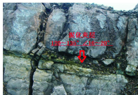
图 1 泥化夹层

分界处为一产状 25 \sim 30^\circ \angle 65^\circ \sim 80^\circ 的 F_1 断层,位置见图 2),根据 I 区边坡地质环境条件和变形特征,取 I 区边坡作为单独块体进行稳定性计算分析,采用以下极限平衡公式计算安全系数: