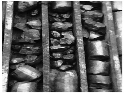
图 1 取出的岩心

ZK3369 孔前期钻进时选用了 HXY-500 型钻机, BW150 型泥浆泵, 采用清水作为冲洗液。开孔孔径 110 mm, 钻进至 16 m 时遇到基岩, 下好 \varnothing 108 mm 定向管后, 换 \varnothing 91 mm 钻具钻进, 钻进 1.1 m, 孔底就开始漏水。继续钻进至 22 m 时发生卡钻现象, 同时发现采取率只有 30%, 取上来的岩心只有个别成柱状, 大多数成块状, 棱角锋利(见图 1)。由此判断该段地层掉块严重, 于是立即采用水泥封孔措施, 水泥封孔时采用了速凝剂, 然而水泥并未在钻孔中堆积, 连续 2 次封孔皆未取得成功, 于是下入 \varnothing 89 mm 套管, 套管在下到 20 m 时遇阻, 采用强力下压的方式下到 22 m, 采用 S75 绳索取心钻具钻进, 钻进至 28 m 发现钻机负荷有所增加, 取心后难以加杆, 需要反复扫孔才能加杆钻进。一旦出现不再进尺, 起钻就会发现钻头和扩孔器已经磨损严重, 不能使用, 更换钻头、扩孔器后下钻下到 28 m 时, 又需要再次扫孔才能加杆钻进。随着孔深增加钻机负荷也越来越大, 只能换低转速钻进。如此反复操作, 由于钻头磨损严重, 进尺能力有限, 连续几天下来只能钻至 45 m, 钻头和扩孔器却消耗无数。