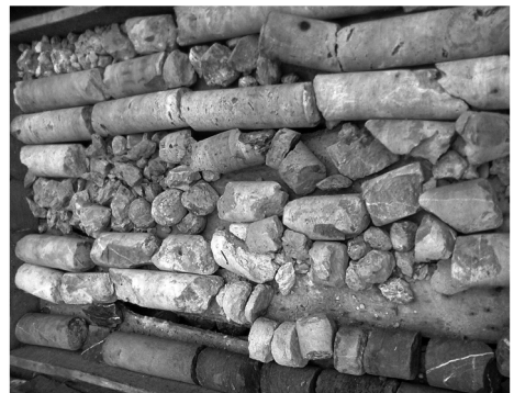
图3 岩心从破碎到完整过渡照片

S75 绳索取心钻具与 \phi 91 mm 跟管钻具配合,施工较为顺利,S75 绳索取心钻具在孔深 92 m 处见到完整岩心(见图 3),但是 \phi 91 mm 跟管钻具扩孔至 85 m 时,钻机负荷变小,不再进尺,只能提钻更换跟管钻头,这次跟管扩到了孔深 93 m,稳定 \phi 89 mm 套管。采用 S75 绳索取心钻具完成了钻孔任务。