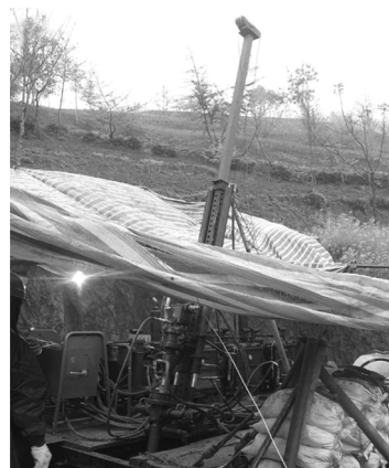
图 2 HQY-500 型钻机试验现场

钻机的野外生产试验是在陕西省西乡县柳树镇蔡家梁地区进行,试验现场见图 2。该区为多金属矿,结构比较复杂,岩层节理发育,部分地区严重破碎坍塌。80 m 以浅为角闪辉长岩,可钻性 5 ~ 7 级;80 ~ 150 m 为钠长斑岩,可钻性 6 ~ 7 级;150 m 以深为较稳定的角闪辉长岩,可钻性 5 ~ 7 级。但是整个地层中间夹杂着石英脉和花岗岩地带,可钻性 7 ~ 9 级,局部 10 ~ 12 级。2010 年 6 月 18 日开孔,8 月 15 日终孔,完成 2 个生产孔,累积钻探工程量 671.08 m。